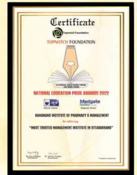
National Education Pride Awards 2022 Most Trusted Management Institute in Uttarakhand