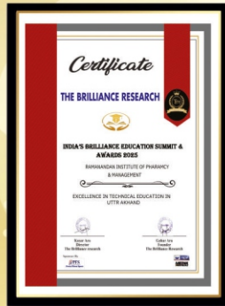
India's Brilliance Education Summit & Awards 2025 Excellence in Technical Education in Uttarakhand