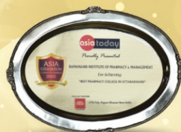
Asia Education Summit & Awards 2020 Best Pharmacy College in Uttarakhand