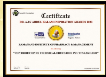
Dr. A. P. J. Abdul Kalam Inspiration Awards 2023 Contribution in Technical Education in Uttarakhand