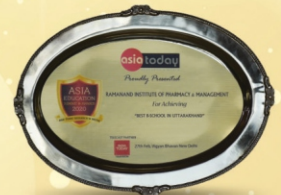
Asia Education Summit & Awards 2020 Best B-School in Uttarakhand