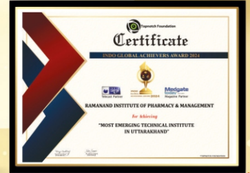
Indo Global Achievers Awards 2024 Most Emerging Technical Institute in Uttarakhand