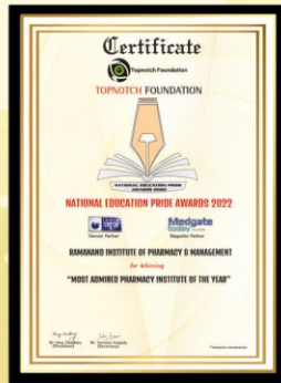
National Education Pride Awards 2022 Most Admired Pharmacy Institute of The Year