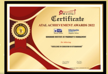
Atal Achievement Awards 2022 Excellence in Education in Uttarakhand