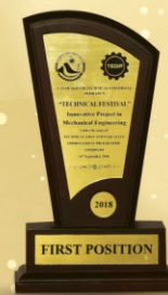
2018 FIRST POSITION